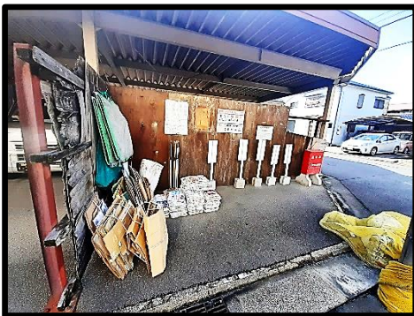
八幡町 5-1 屋根の下