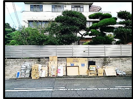
中町 6-9 前 塀の前