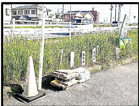
八幡町 10-1 前辺り 三滝通り沿い