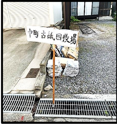
中町 7-21 隣 道路側